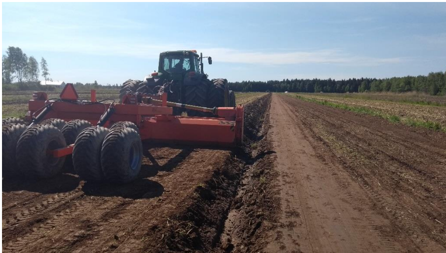
Bild 2. Planad dikjord med MPH Planerskruv.